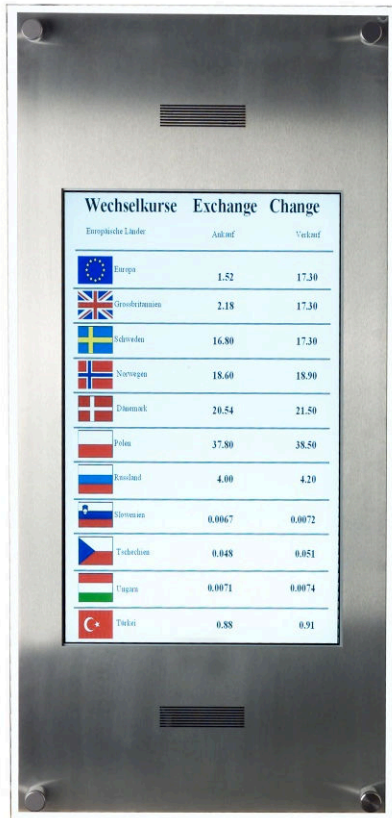
42" System aus Edelstahl und mit Schutzscheibe

Es ist nicht immer leicht, die ständig wechselnden Bedürfnisse der Konsumenten von heute einzuschätzen und ihnen gerecht zu werden. Mit den Digital Signage Systemen vom multitech wurden Hard- und Softwarelösungen entwickelt, die nicht nur den aktuellen Bedürfnissen gerecht werden, sondern auch zukünftigen Herausforderungen standhalten werden.