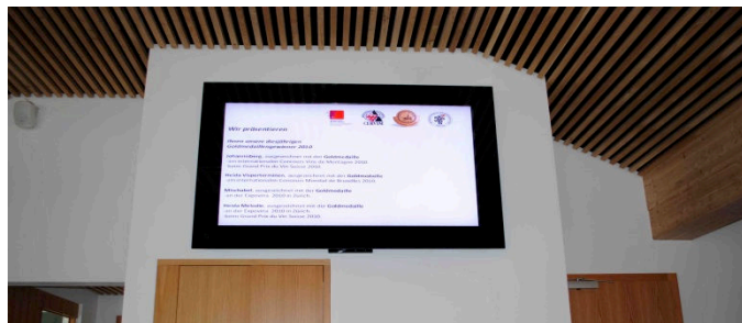
70" Display Flachmontage

Bei den verwendeten Komponenten handelt es sich ausschliesslich um Teile die für den professionellen Einsatz konzipiert sind. Dies bezieht sich sowohl auf die Elektronik, wie auch auf die verwendeten Materialien für das Gehäuse. Es werden Grössen von 10,4" bis 80" angeboten. Diese können sowohl in Landscape- wie auch in Portrait-Format installiert werden.