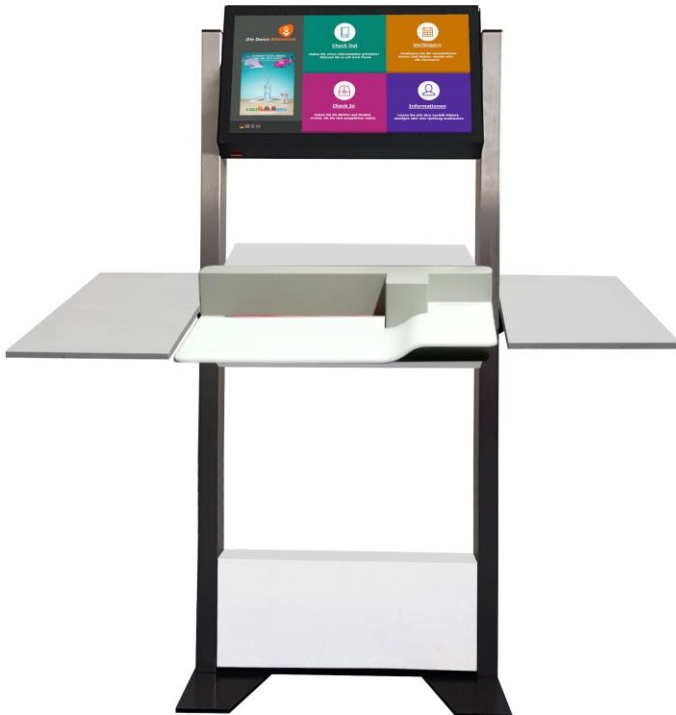
H-Type Standgerät mit EM-Sicherung

Der H-Type von multitech kombiniert mit der neusten itrack Selbstverbuchungssoftware besteht einerseits durch die Funktionalität und die einfache Bedienung der Software und andererseits durch das zeitlose, elegante Design des Selbstverbuchers. Die Identifikation der Bücher erfolgt über einen integrierten Barcode-Leser. Die Sicherung der Magnetstreifen wird über den L-Winkel in der Ablage sichergestellt.